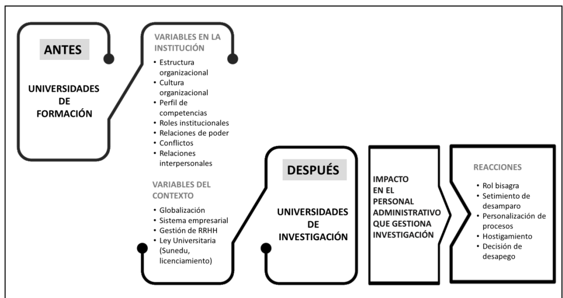
Figura 1. Guía de variables

El siguiente gráfico muestra las variables que forman parte de la evolución entre ambos escenarios. Para fines de este estudio, dentro de las variables de la institución, nos concentraremos en la cultura organizacional, en las relaciones de poder, los conflictos y los roles institucionales; sumados a estos, nos detendremos en entender las variables del contexto cambiante como la globalización, el sistema empresarial y la Ley peruana. Comprender cada uno de estos aspectos desde la perspectiva de los administrativos que gestionan la investigación, nos ayuda a descubrir el impacto que este cambio causa en ellos.